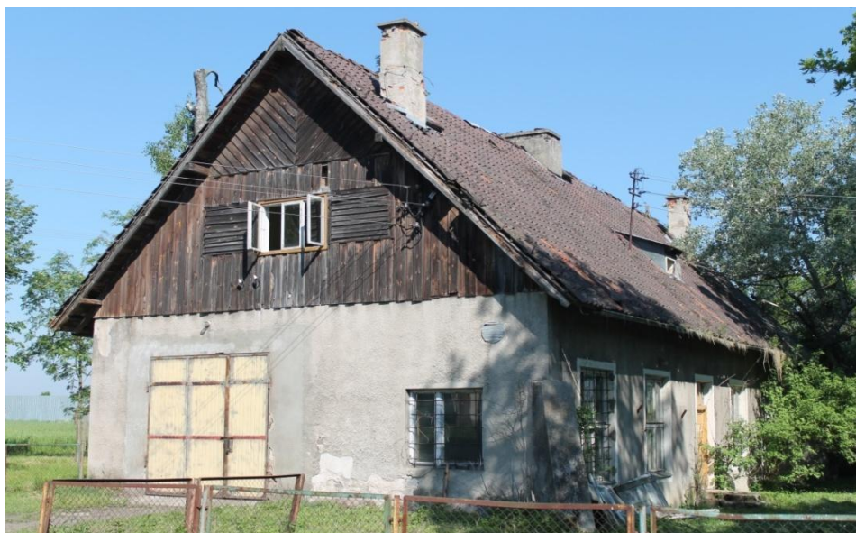
Fot. nr 4. Stary budynek szkoły

W 1964 roku Dwuletnia Szkoła Rolnicza została przekształcona w Zasadniczą Szkołę Rolniczą. Zajęcia odbywały się w starym i nienadającym się do użytku budynku, zaadoptowanym do potrzeb szkoły (fot. 4.), który mieścił się naprzeciwko obory.