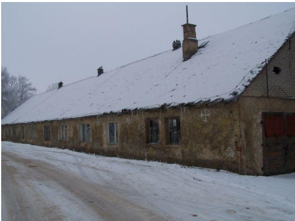
Fot. nr 5. Budynek starego internatu

Trudna sytuacja lokalowa szkoły i internatu (fot. 5.) oraz wzrost liczby oddziałów sprawiły, że w 1966 roku rozpoczęto budowę nowego obiektu szkolnego wraz z internatem na 120 miejsc.