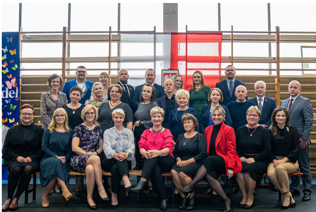
Fot. nr 11. Rada Pedagogiczna ZS Niećkowo w 2021 roku

Zdjęcie Rady Pedagogicznej z 2021 r. stanowi fot. 11.