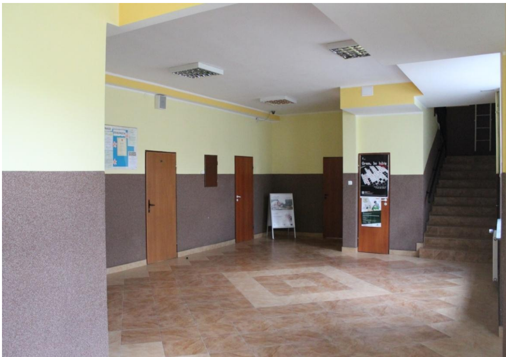
Fot. nr 22. Wnętrze korytarza szkolnego

Następcą Pana Kuczyńskiego w roku 2011 został obecny dyrektor Pan Dariusz Koniecko. Jego kadencja to dekada kolejnych wyzwań, przedsięwzięć i ważnych dla szkoły inwestycji. W okresie tym doposażono i wyremontowano kolejne pracownie oraz szkolne korytarze (fot. 22.)