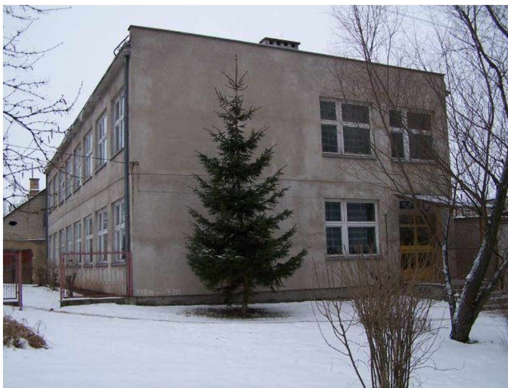
Fot. nr 7. Budynek szkoły nr 2

W 1982 roku rozpoczęto budowę kompleksu warsztatów szkolnych wraz z budynkiem pracowni teoretycznych, którą zakończono 2 lata później (fot. 7.).