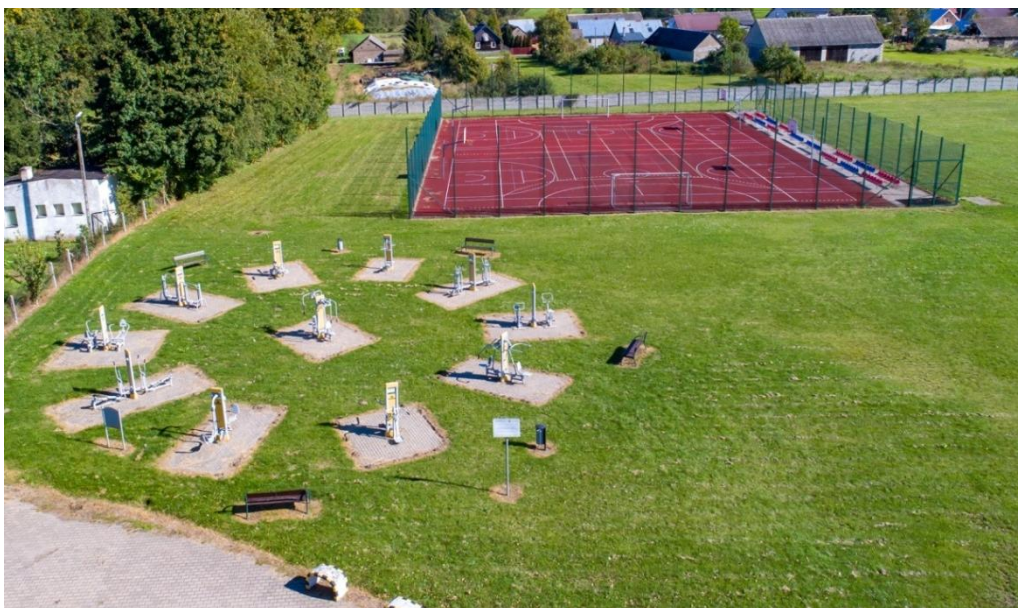
Fot. nr 24. Szkolny łącznik