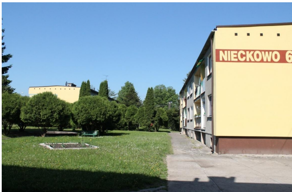
Fot. nr 8. Osiedle mieszkaniowe

W dniu 29 czerwca 1985 roku szkoła przeżywała wielkie święto. Wtedy właśnie Zespół Szkół Rolniczych otrzymał imię Bolesława Podedwornego (znanego działacza ludowego, syna ziemi łomżyńskiej).