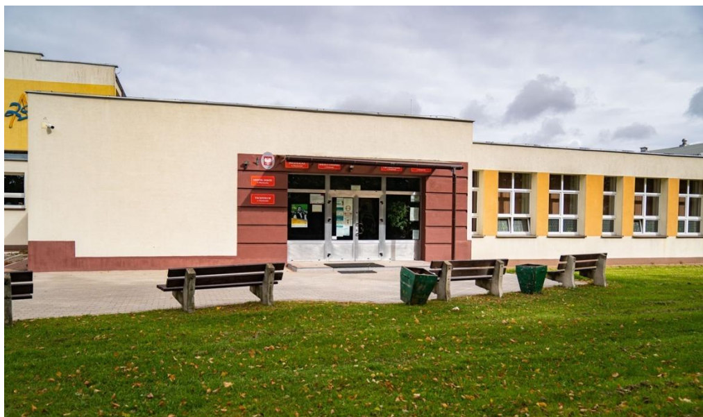
Fot. nr 17. Wejście do budynku szkoły nr 2