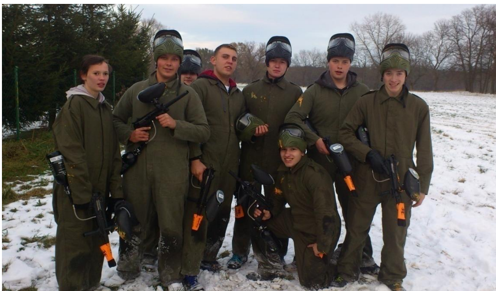
Fot. nr 25. Drużyna Paintballa

W 2005 roku nasza szkoła nawiązała współpracę z zaprzyjaźnioną szkołą ukraińską z Równego. Przez kilka lat, niemal corocznie, odbywały się kilkudniowe wymiany młodzieży, w których uczestniczyło ok. 10 uczniów z każdej strony (fot. 26.). Natomiast od 2007 roku w podobnej wymianie uczestniczyli również nauczyciele.