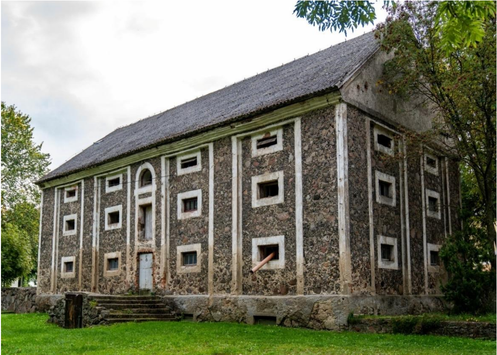
Fot. nr 1. Spichlerz zbożowy z trzeciej ćwierci XIX w.

Oprócz tego państwo Bzurowie dokonali również przebudowy dworu. Gontowy dach zastąpiono czerwoną dachówką, do północno – zachodniego szczytu dobudowano przybudówkę, nad głównym wejściem pojawił się murowany portyk kolumnowy (zwieńczony trójkątnym przyczółkiem o falistych konturach), po stronie przeciwnej portyku pojawił się taras (fot. 2., fot. 3.).