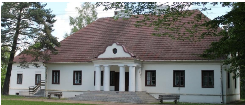
Fot. nr 3. Dworek szlachecki z 1. poł. XIX w. (widok dzisiejszy od tyłu)