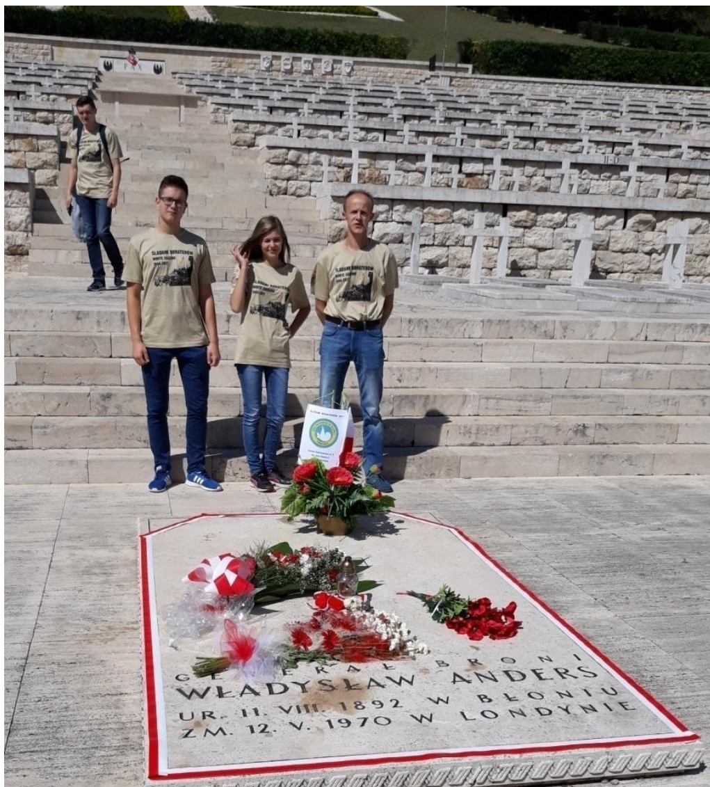
Fot. nr 28. Cmentarz wojenny Monte Cassino – Włochy, 20.09.2017 r.

Kolejnym projektem, w który zaangażowała się szkoła jest projekt – „Kompleksowy program rozwoju Zespołu Szkół im. Bolesława Podędwornego w Nieckowie”, realizowany od maja 2017 do grudnia 2018 roku. Celem głównym projektu było podniesienie kompetencji zawodowych 169 uczniów, zwiększające ich szanse na rynku pracy. Odbывало to się poprzez realizację staży i praktyk, kursy, szkolenia oraz podniesienie jakości nauczania przez wyposażanie szkoły w sprzęt niezbędny do kształcenia zawodowego. W projekcie mogli też uczestniczyć nauczyciele zatrudnieni w szkole.