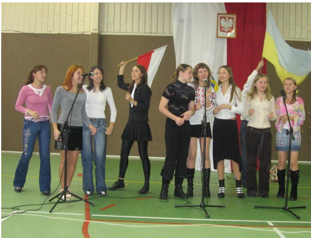
Fot. nr 26. Występ pożegnalny gości z Ukrainy

Nasza szkoła to instytucja podejmująca ciągle nowe wyzwania, które wynikają z dzisiejszych realiów gospodarki wolnorynkowej. Potwierdzeniem tego były chociażby organizowane corocznie konferencje pod nazwą Agro - Podlasie (fot. 27.), na które zapraszani byli przedstawiciele władz centralnych, wojewódzkich, samorządowych oraz osoby reprezentujące różne branże i instytucje. Ich adresatem byli głównie tutejsi rolnicy i przedsiębiorcy, którzy u samego „źródła” mogli dowiedzieć się o ważnych dla nich sprawach.