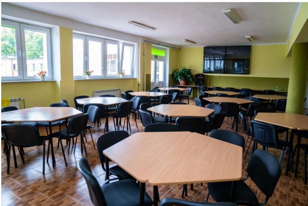
Fot. nr 21. Stołówka internacka

Istotny wkład w funkcjonowanie oraz modernizację internatu wniósł też Pan Stefan Jaczun, który funkcję kierownika sprawował w latach 2007 – 2015. To właśnie wtedy wyremontowano większość pomieszczeń internackich wraz ze stołówką (fot. 21.).