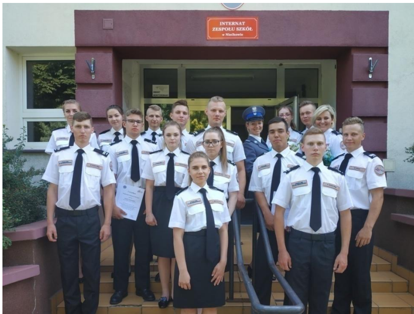
Fot. nr 32. Skoszarowanie Policijnej Klasy Mundurowej w dniach 25-26 września 2020 r.