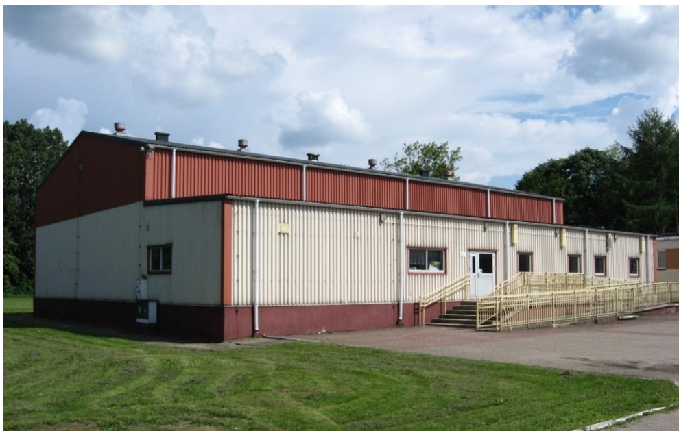
Fot. nr 9. Sala gimnastyczna

W 1999 roku, po kilkuletnim okresie renowacji, oddano dla potrzeb szkoły XIX wieczny dworek, w którym obecnie znajdują się głównie pracownie żywności.