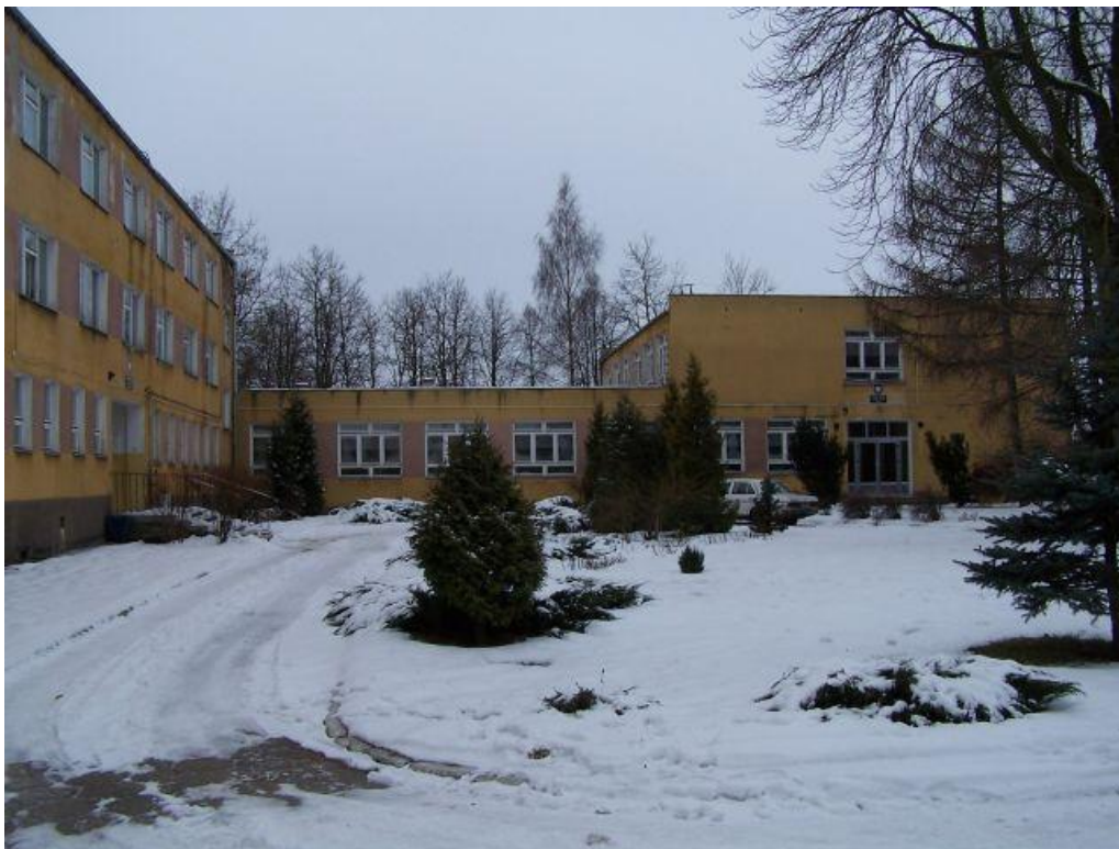
Fot. nr 6. Nowy budynek szkoły wraz z internatem

W 1974 roku powołano 3 letnie Technikum Rolnicze dla absolwentów zasadniczych szkół rolniczych i szkół przysposobienia rolniczego.