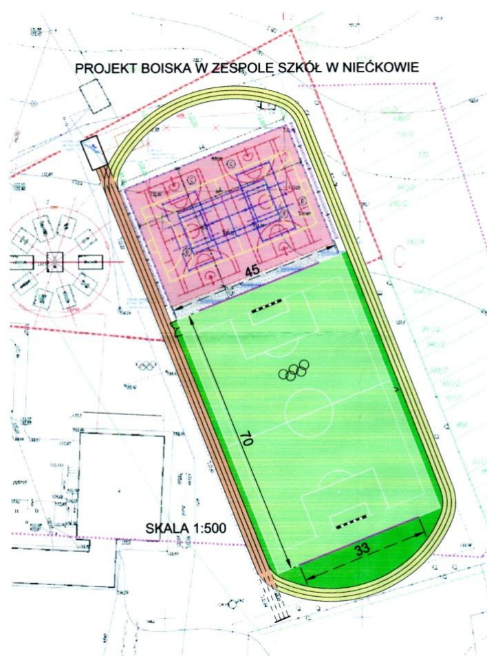
Fot. nr 33. Plan zagospodarowania terenu pod budowę boiska trawiastego do piłki nożnej z bieżnią lekkoatletyczną.